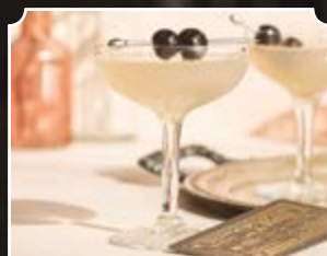
Ostatnie Słowo Miłości

Szukasz eliksiru miłosnego, który pomoże ci zdobyć miłość? Potrzebujesz czarodziejskiej nalewki na przeziębienie? A może pragniesz przygotować magiczny koktajl przyciągający pieniądze?