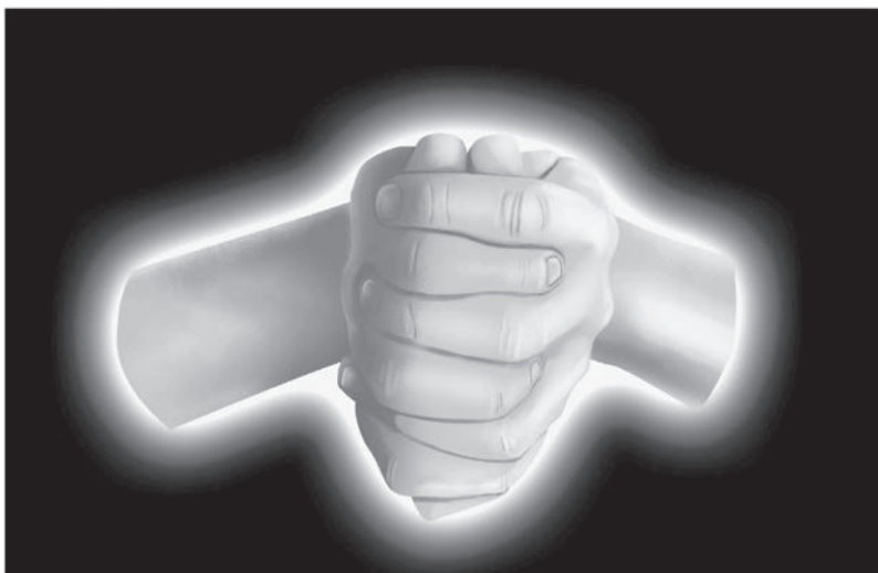
Ilustracja 1.3. Alternatywna mudra 14 oddechu pozwala na obecność zarówno męskiej, jak i żeńskiej energii jednocześnie.

w stronę zewnętrznej ani wewnętrznej części dłoni) i zobacz, czy możesz przenieść w dłoniach wodę. Jeśli nic nie przecieka – zrobiłeś to właściwie. Mudra umożliwia obecność zarówno męskiej, jak i żeńskiej energii jednocześnie. Jeśli korzystając z tej mudry przeniesiesz wodę bez przeciekania – wykonałeś ją poprawnie.