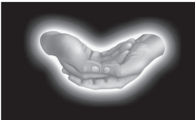
Ilustracja 1.2. Mudra 14 oddechu równoważy męskość i kobiecość zgodnie z potrzebą.

Każda osoba wybiera jedną lub drugą pozycję. W tej mudrze kładziemy na wierzchu prawą lub lewą rękę. Większość mężczyzn robi to z lewą ręką na wierzchu, a większość kobiet z prawą, ale możliwe, że u Ciebie będzie na odwrót. Prawa ręka na wierzchu dodaje polu męskiej energii; lewa – żeńskiej. Kobiety potrzebują najczęściej więcej męskiej energii – i vice versa. Kiedy dana osoba nie identyfikuje się ze swoimi gonadami, może być na odwrót.