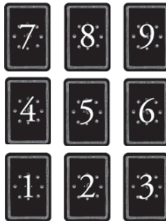
Ilustracja 1–4: Co cię woła