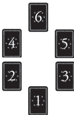
Ilustracja 1-3: Przebudzenie uśpionych energii