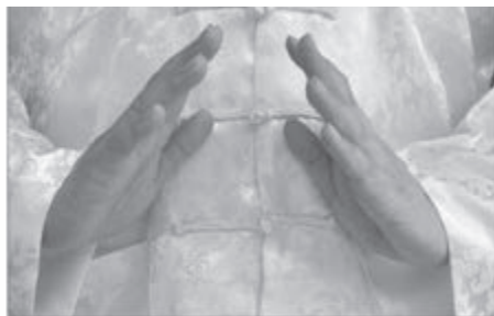
Rys. 2. Dłonie w Pozycji Piramidy Shen Mi

Usiądź prosto na krześle mając wolne miejsce za plecami i o nic się nie opierając. Ułóż dłonie w Pozycji Piramidy 4 (patrz: rys. 2.).