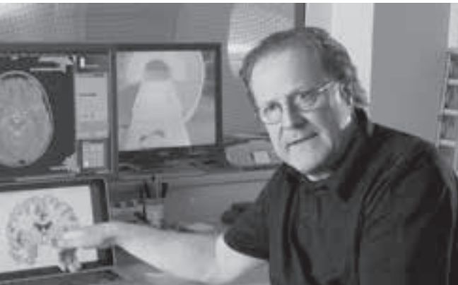
Neurobiolog, lekarz psycho- terapeuta Joachim Bauer: Trwały stres wpływa nega- tywnie na stan zdrowia.

Kto lub co przyczynia się do powstawania tak dużych różnic pomiędzy Skandynawią a krajami niemieckojęzycznymi? Z pewnością nie chodzi o niedobór lekarzy, bowiem na 1000 mieszkańców w Austrii przypada 4,6 lekarzy, a w Niemczech 3,7. Jest to więcej niż przeciętnie w Europie (3,4) 3 .