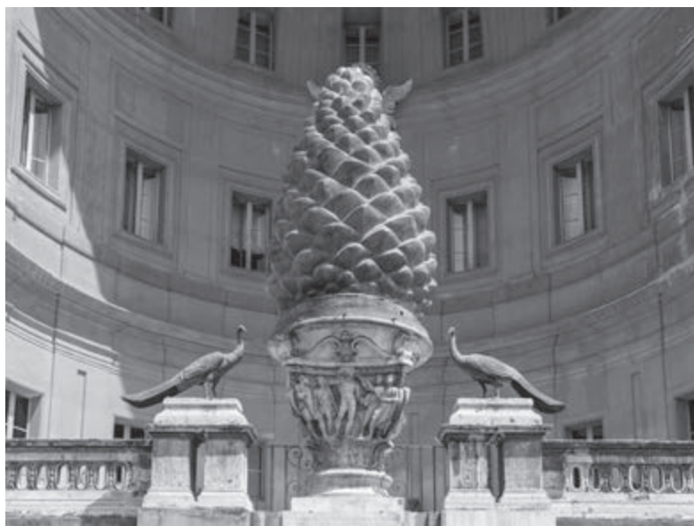
„Cortila della Pigna” w Watykanie

W hinduizmie spotykamy się z obrazami, w których symbolika szyszki łączy się z wężem. Wielu hinduskich bożków przedstawianych jest z szyszką w dłoni. W starych asyryjskich budowlach pałacowych, które powstały prawdopodobnie około 710 r. p.n.e., znaleźć można czteroskrzydłowe boskie figury trzymające w górze szyszki, co było interpretowane jako symbol wiecznego życia.