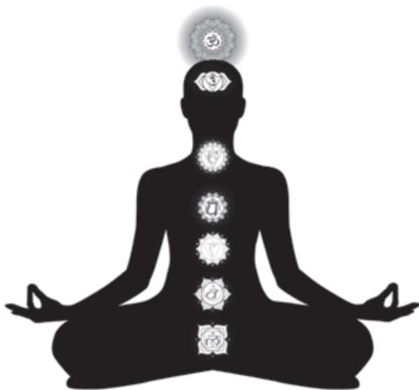
Układ czakr u człowieka

kosmosu. Czakry powodują, że w człowieku rozchodzi się kosmiczna energia życiowa.